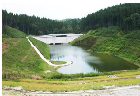
池について(調整池)