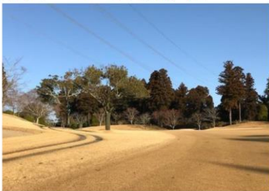
樹木について(戦略木)