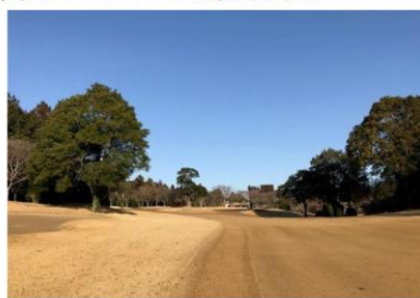
樹木について(景観木)