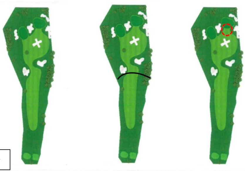
左ドックのホール