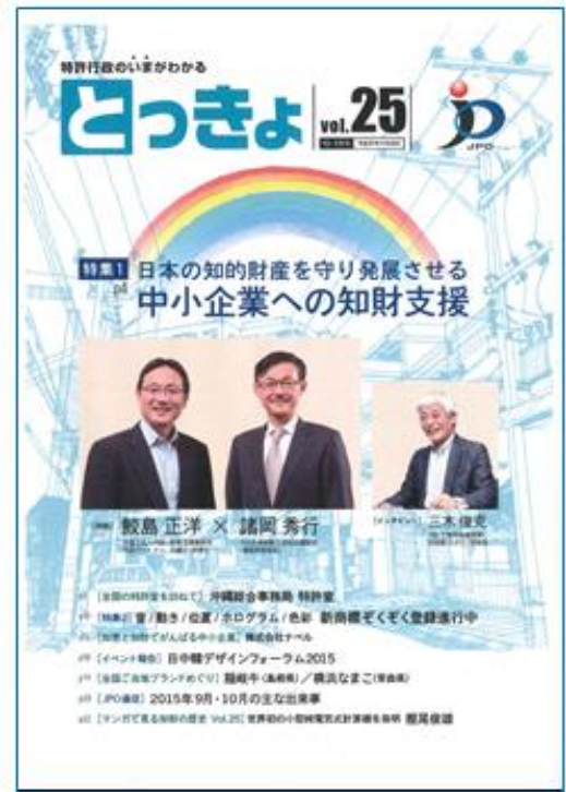
特許庁広報誌『とつきよ』2015年12-1月号