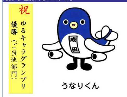
【例1】登録商標「うなりくん」

権利者は、成田市で、平成22（2010）年5月に登録、指定商品の範囲は当初3種で、翌年2011年に指定商品として、着ぐるみ用衣類などを追加しております。