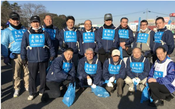
12月19日（火）、成田環境ネットワーク、空港周辺道路美化活動が実施されました。当日参加された方々、寒い中お疲れ様でした。

いと思います。成田ロータリークラブの存在をアピールするためにも、当日は当クラブのジャンパーを着用していただきたいと思っておりますけれども、かなり着込んだ中でジャンパーが着られるかどうか心配なんですけれども、さきほど成田会長に相談しましたら「私は大丈夫」ということですので、参加される方は当クラブのジャンパーを用意して参加していただきたいと思っておりますのでよろしくお願いいたします。雨天の場合には当日案内を申し上げます。