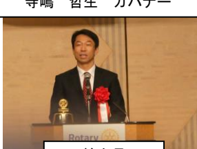
柏市長 秋山 浩保