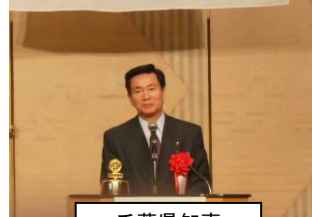
千葉県知事 森田 健作